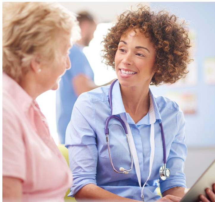
Ondersteuning bij klinische besluitvorming

EBSCO biedt bronnen en tools die de medische gemeenschap wereldwijd informeren en helpen zorgresultaten te verbeteren. Het aanbod bestaat uit evidence-based oplossingen voor klinische en gezamenlijke besluitvorming, peer-reviewed wetenschappelijke onderzoeksinformatie en meer.