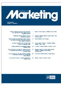
Journal of Marketing