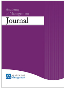
Academy of Management Journal