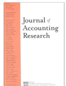
Journal of Accounting Research