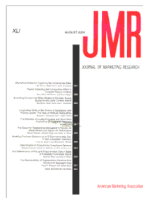
Journal of Marketing Research