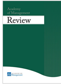
Academy of Management Review