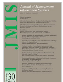
Journal of Management Information Systems