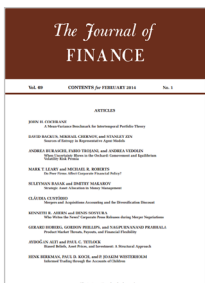
The Journal of Finance