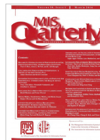
Management Information Systems Quarterly