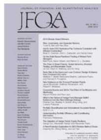
Journal of Financial and Quantitative Analysis