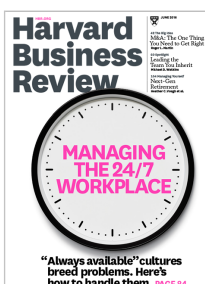
Harvard Business Review