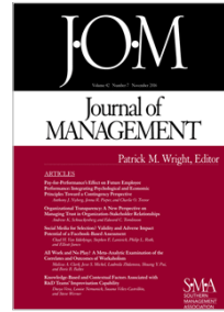
Journal of Management