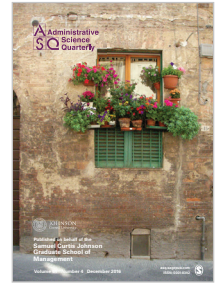
Administrative Science Quarterly