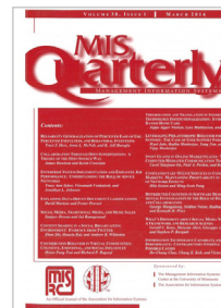
Management Information Systems Quarterly