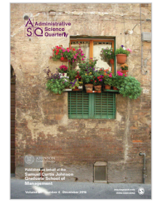
Administrative Science Quarterly