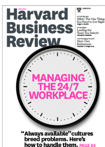
Harvard Business Review