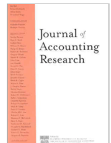
Journal of Accounting Research