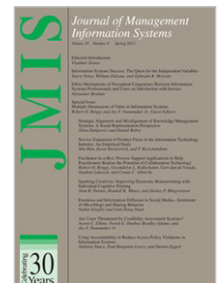
Journal of Management Information Systems